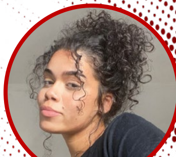
Karine Ferreira (Agência Mural)