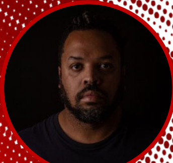
Taba Benedicto (Estadão)