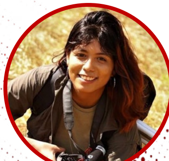
Hellen Lirtéz (Amazônia Real)