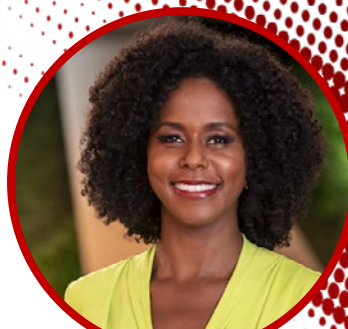
Maju Coutinho (TV Globo)