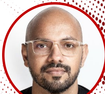
Tiago Rogero (The Guardian/Projeto Querino)