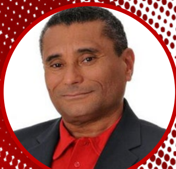
Paulo César Vasconcellos (Sportv)