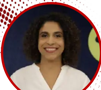
Iara Balduino (TV Brasil)