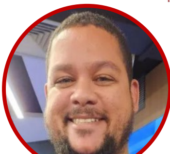
Léu Britto (Agência Mural)