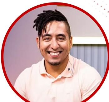
Luiz Teixeira (Sportv/GE)