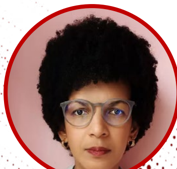
Shagaly Ferreira (Estadão)