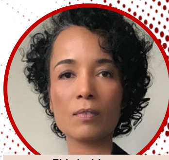
Flávia Lima (Folha de S.Paulo)