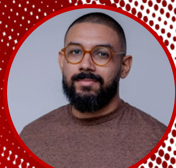
Rubens Rodrigues (O Povo)